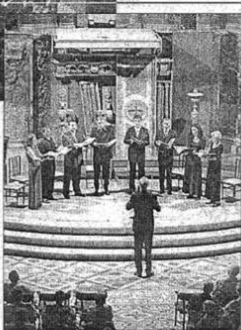
Las voces de los artistas pusieron la nota excepcional.

El pasado lunes se cerró el certamen de verano en la iglesia del Socors de Ciutadella